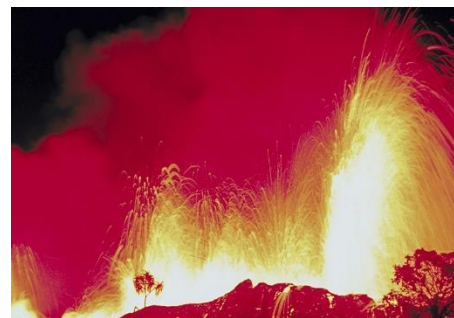
Doc. 2. Une éruption volcanique